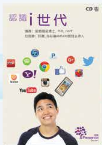
親子家庭教育系列： 認識 i 世代 粵語 CD