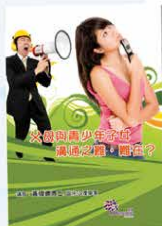
親子家庭教育系列： 父母與青少年子女溝通之難，難在？ 粵語 2CDs/DVD