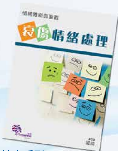
心理健康系列： 哀傷情緒處理 國語 1DVD 或 2CDs