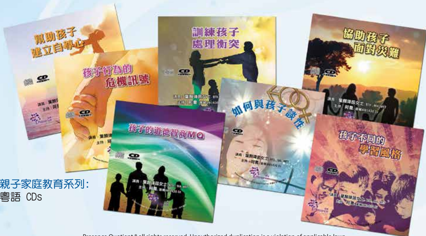
親子家庭教育系列： 粵語 CDs