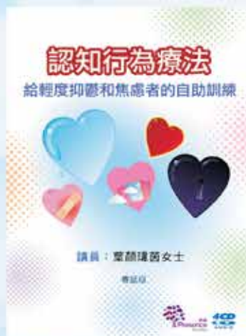
心理健康系列： 認知行為療法 給輕度抑鬱和焦慮者 的自助訓練 粵語 4CDs